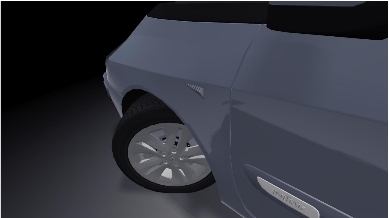
Jantes Epitus 17"